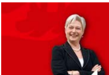
Minister van der Hoeven CDA

Toch staat op 10 februari aanstaande de invoering van de 'slimme' energiemeter op de agenda van de Eerste Kamer. Als men daar de plannen niet rigoureus afwijst zou men instemmen met het goedkeuren van de wetsvoorstellen 31320 en 313742 die tegen alle fundamentele burgerrechten van onze grondwet en van het internationale verdrag van de rechten van de mens indruisen.